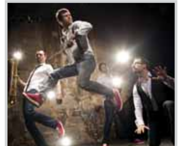
26. Internationales Jazz Festival Sankt Ingbert 2012 Young German Jazz: Mo' Blow

Telefon 06894/13-523, E-Mail: pbohrer@st-ingbert.de .