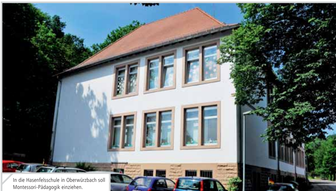
In die Hasenfelschule in Oberwürzbach soll Montessori-Pädagogik einziehen.

möglich. Die Hoffnung der Ortsvorsteherin: „Es ist wichtig, dass das Gebäude weiter als Schule genutzt wird. Wo möglich gibt es dadurch die Chance, bei erhöhten Geburtenzahlen wieder einen Regelzweig zu installieren.“