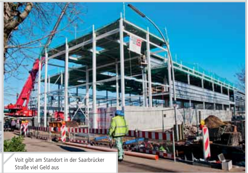
Voit gibt am Standort in der Saarbrücker Straße viel Geld aus