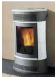
Pelletofen in Firma