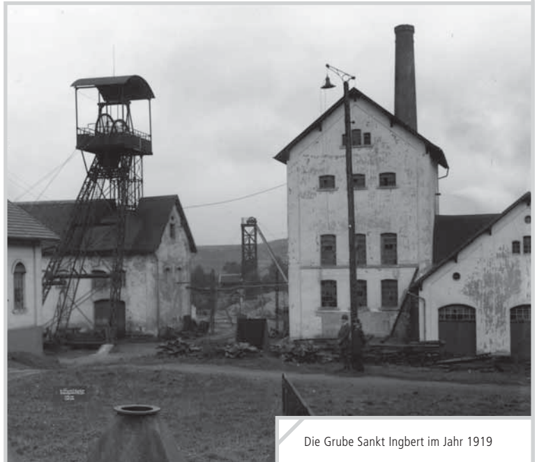
Die Grube Sankt Ingbert im Jahr 1919

Info: Der Pin kostet zwei Euro. Er wird bei Fastnachtsveranstaltungen angeboten. Auch im Rathaus-Foyer, bei der Buchhandlung Friedrich und bei Buch und Papier Klein und während des Umzuges kann er erworben werden.