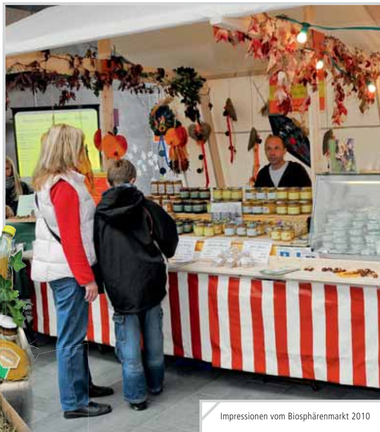
Impressionen vom Biosphärenmarkt 2010

Weitere Informationen unter www.st-ingbert.de