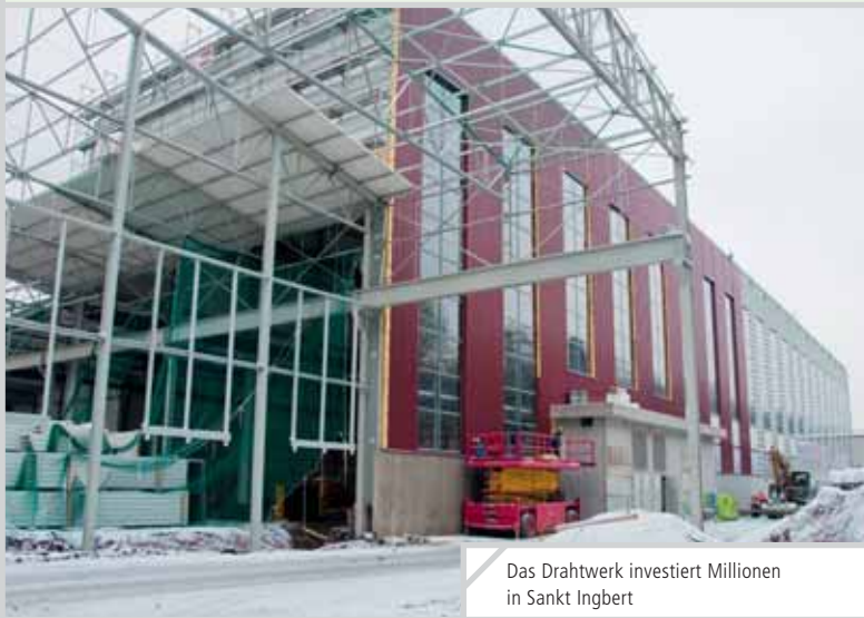
Das Drahtwerk investiert Millionen in Sankt Ingbert