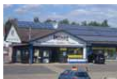
Fa. Musteranlagen in Funktion