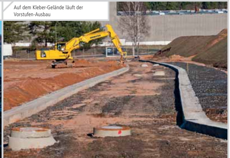
Auf dem Kleber-Gelände läuft der Vorstufen-Ausbau