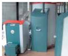
Solarheizung mit Pelletkessel