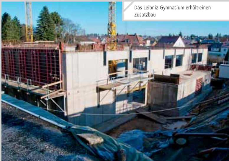
Das Leibniz-Gymnasium erhält einen Zusatzbau